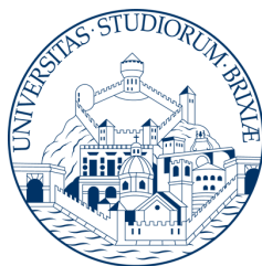
UNIVERSITÀ DEGLI STUDI DI BRESCIA